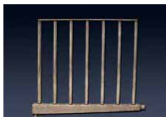
Pour une distance d'absorption inférieure à 914 mm