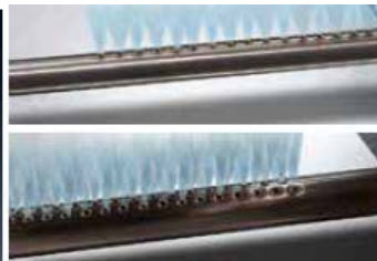
Pour une distance d'absorption inférieure à 1500 mm