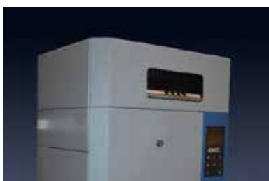
SDU pour les modèles SKE-4-E05 à SKE4-E30