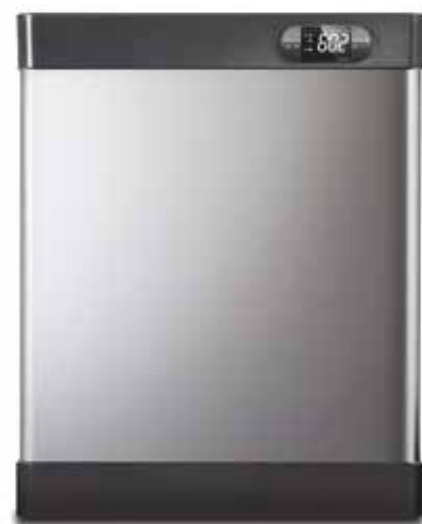
LEHnéo 6, 12, 24

Le plus Teddington : Générateur vapeur à pression atmosphérique : diffusion de la vapeur dans le hammam en silence.