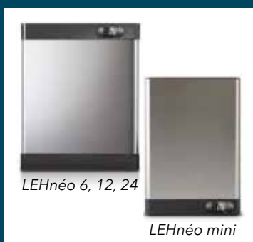
LEHnéo 6, 12, 24